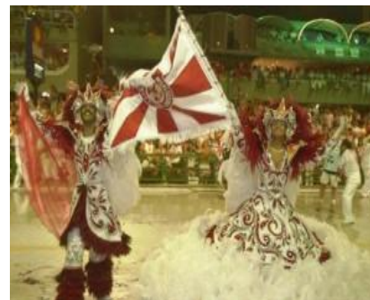
Desfile de escola de samba, transmitido pela televisão.

Carna Vale - Festa popular coletiva realizada anualmente nos 3 dias que antecedem a quaresma, do domingo da quinquagésima à 4ª feira de cinzas. Antes de ser institucionalizado pela Igreja Católica, o carnaval era uma festividade profana, um culto a deusa Ísis (deusa egípcia que tinha o poder de dar a vida, deusa da fertilidade). Quando o rio Nilo enchia, os egípcios faziam festas que duravam dias em agradecimento à deusa. O culto a Ísis foi difundido e várias nações passaram a cultuá-la e a comemorar seus feitos em festas populares, que acabavam em orgias, bebedices e perversões sexuais. A Igreja Católica, na Idade Média deu uma feição sacra a festa, inserindo-a próxima a quaresma. Seu objetivo era arrebanhar os pagãos, tornando o evangelho “mais acessível” ao povo, no pensar dos dirigentes católicos. A festa medieval era feita pelo povo, os senhores feudais admiravam de longe. Basicamente, a festa era formada pelo Rei e sua corte, isto é, os pobres, vestidos de máscaras e roupas sujas, estabeleciam um reinado às avessas, onde o rei vinha em trono de madeira, sujo e maltrapilho. A encenação tinha seu ponto máximo na praça central onde a dança e a licenciosidade alcançavam seus maiores momentos. Atualmente, as festas são pomposas, os ricos misturam-se aos pobres, mas a inversão dos valores, a licenciosidade, a orgia só tem aumentado. Nesses próximos dias, será realizado em nosso país, o carnaval.